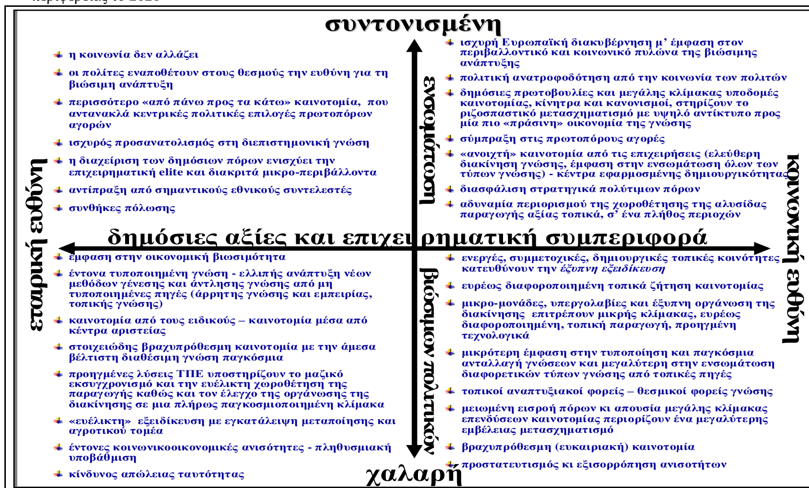
Εικόνα 2: Κοινωνικοοικονομικό πλαίσιο έξυπνης εξειδίκευσης , εξελίξεις και τάσεις τεσσάρων σεναρίων για την Ελλάδα της Ευρωπαϊκής περιφέρειας το 2020