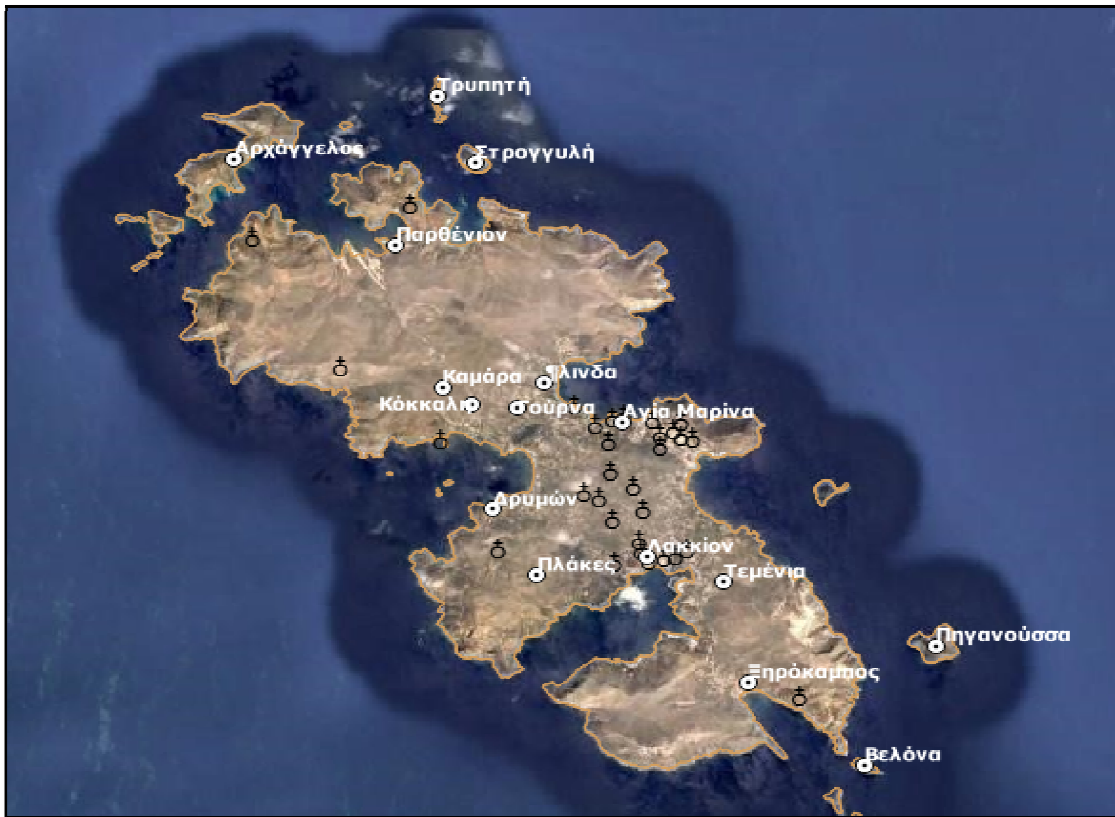
Εικόνα 1: Ψηφιακή Τηλεπισκοπική Απεικόνιση της Λέρου στην οποία εμφανίζονται οι εκκλησίες και βασικοί οικισμοί.