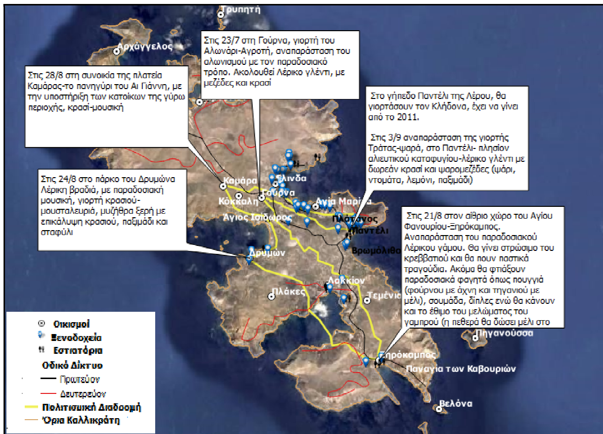
Εικόνα 6. Ψηφιακή Τηλεπισκοπική Απεικόνιση πολιτιστικών δρώμενων σύμφωνα με το πρόγραμμα του Δήμου Λέρου για το καλοκαίρι του 2016