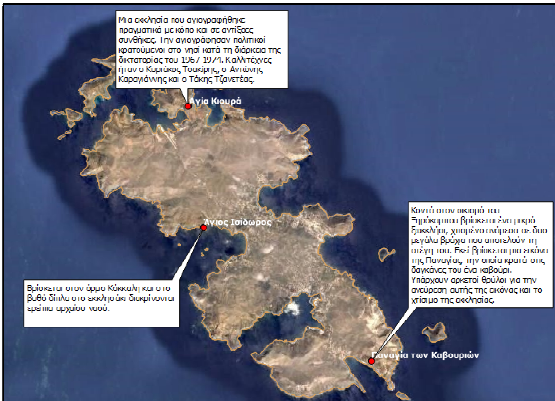
Εικόνα 2. Ψηφιακή Τηλεπισκοπική Απεικόνιση με τις τοποθεσίες των εκκλησιών Αγία Κουρά, Άγιος Ισίδωρος και Παναγία των Καβουριών