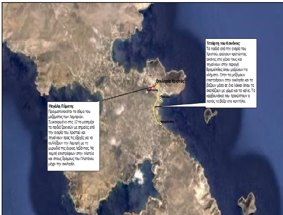
Εικόνα 4. Ψηφιακή Τηλεπισκοπική Απεικόνιση με τις διαδρομές της Τετάρτης του Κανόνας και της Μεγάλης Πέμπτης