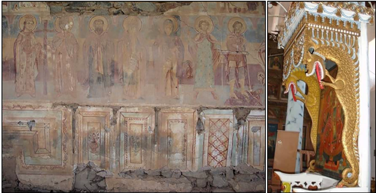
Εικόνες. 7, 8. Τοιχογραφίες του κοιμητηριακού ναού της Παναγίας στη Χαλάρα (πάνω αριστερά) και δεσποτικός θρόνος στο ναό του Αγ. Νικολάου του ίδιου οικισμού (πάνω δεξιά).