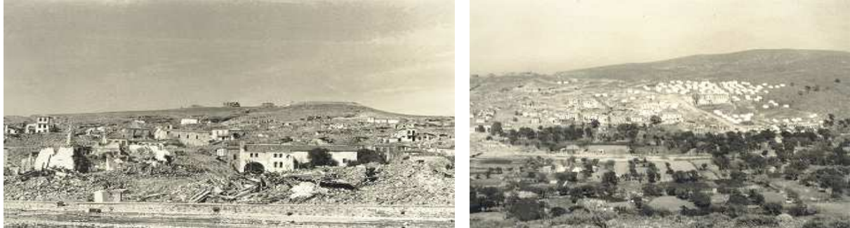
Foto 3. The settlement after the earthquake and the resident camp