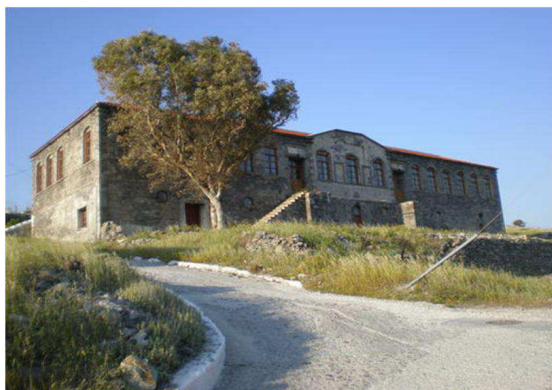
Τύπος 4. Πορφύρειος – Μαρασλείος Σχολή 1