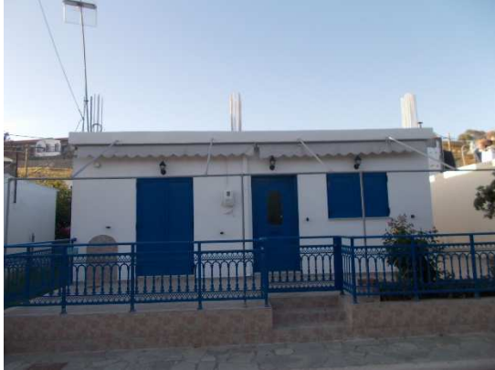
Τύπος 1. Μετασεισμικά κτίσματα