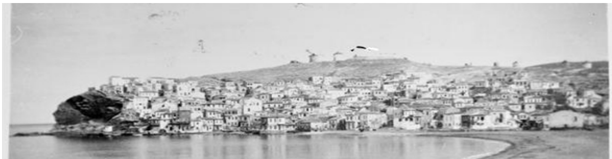
Foto 2. The pre-earthquake settlement of Agios Efstratios

Πηγή: Μουσείο Πολιτικών Εξοριστών Αη Στράτη ( http://www.exile-museum.gr/ )