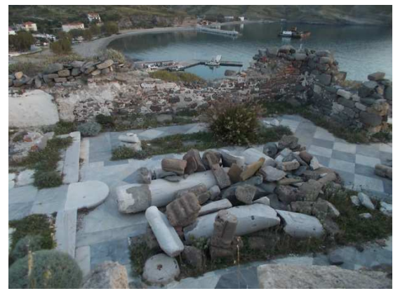
Τύπος 4. Ερείπια του παλαιού οικισμού