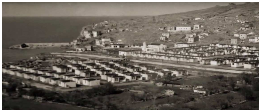
Foto 4. The new settlement after the earthquake