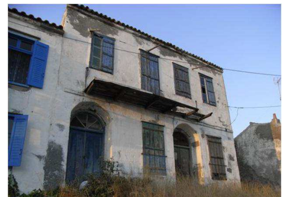
Τύπος 4. Κτίριο στον Παλαιό Οικισμό