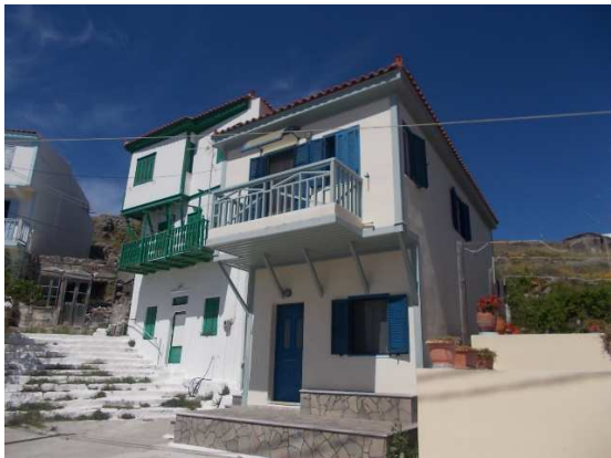
Τύπος 3. Αναστηλωμένα Παραδοσιακά Κτίρια