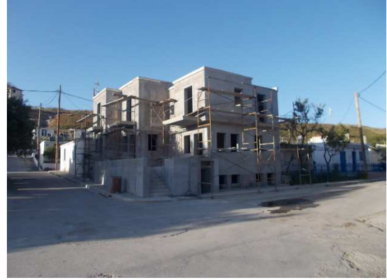
Τύπος 2. Νεοαναγειρόμενα κτίσματα