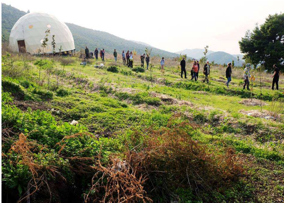
Εικόνα 2. Κατασκευή γεωδαιτικού θόλου και οι καλλιέργειες στο κτήμα των Free & Real Foto 2. Geodesic dome and crops at the Free & Real site