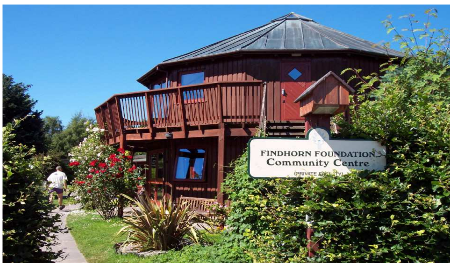
Εικόνα 1. Το κοινοτικό κέντρο του Findhorn (findhorn.org)

Η οικοκοινότητα διαθέτει περισσότερα από 100 οικολογικά κτίρια, βιολογικό σύστημα επεξεργασίας λυμάτων και ένα ολοκληρωμένο σύστημα ανακύκλωσης. Παράγει ενέργεια από τέσσερις ανεμογεννήτριες, ενώ συμμετέχει και στο πρόγραμμα “Origin” (The Origin Project, origin-energy.eu) το οποίο στοχεύει στον συγχρονισμό των ενεργειακών αναγκών με την τοπικά παραγόμενη ηλεκτρική ενέργεια. Ακόμα, διαθέτει πολυάριθμα ηλιακά συστήματα θέρμανσης νερού, ενώ, το 2010, εγκατέστησε και ένα λέβητα βιομάζας 250 kW, για να εξυπηρετήσει την κεντρική περιοχή του πάρκου. Μέσω όλων αυτών των δραστηριοτήτων στο “χωριό” του Findhorn, έχουν επιτύχει να έχουν ένα οικολογικό αποτύπωμα που είναι περίπου το μισό του εθνικού (για το Ηνωμένο Βασίλειο) κατά μέσο όρο(findhorn.org).