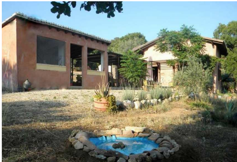
Εικόνα 4. Άποψη κτιριακών εγκαταστάσεων στο Ελπιδοχώρι Foto4. View of building infrastructure at Elpidohori

Ως εκ τούτου, το πλάνο εκκίνησης δημιουργίας του Ελπιδοχωριού στόχευσε την προσέλκυση ανθρώπων που εθελοντικά θα συνέβαλαν στη δημιουργία ενός εγχειρήματος αυτάρκειας, ενεργειακής και διατροφικής πρωτίστως, και σκοπό να προσομοιάσει τη λειτουργία με αντίστοιχες κοινότητες στο εξωτερικό όπως οι Findhorn και Damanhur.