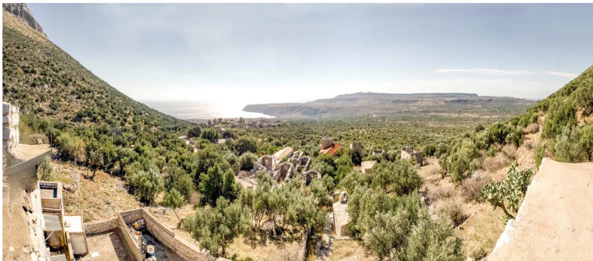
Εικόνα 1. Γενική άποψη του Διπόρου. Στο βάθος διακρίνεται το υψίπεδο στο Κατωπάγκι, το ακρωτήριο Κάβο Γκρόσσο και ο κόλπος του Γερολιμένα.

Η παρούσα εισήγηση εξετάζει τον ημιορεινό και εγκαταλειμμένο σήμερα οικισμό του Διπόρου Μέσα Μάνης. Επεκτείνεται σε προτάσεις για μια ολοκληρωμένη προστασία και ήπια ανάπτυξη του, λαμβάνοντας υπόψιν τις τοπικές ιδιαιτερότητες αλλά και τις εν δυνάμει δυνατότητες ανάπτυξης στο πλαίσιο της σημερινής οικονομικής συγκυρίας. Η ανάλυση της ιδιαίτερης ταυτότητας του τόπου και η αξιολόγηση των υφιστάμενων δομών του πραγματοποιήθηκε με γνώμονα τόσο την έρευνα πεδίου, όσο και την βιβλιογραφική - αρχειακή διερεύνηση. Η σύνθεση των δεδομένων αυτών αποτέλεσε βασική προϋπόθεση για την συνολική επεξεργασία και κατάρτιση των προτάσεων.