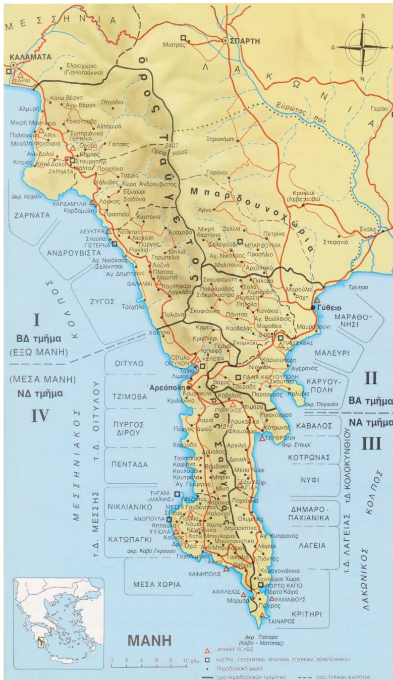
Εικόνα 1. Γεωφυσικός χάρτης και υποδιαίρεσεις-τοπικές ενότητες της Μάνης.

Σήμερα, η εδαφική αυτή διαμόρφωση που καθιστά δύσκολη την ανάπτυξη τοπικών παραγωγικών ασχολιών, σε συνδυασμό με τις κοινωνικό οικονομικές μεταλλαγές του 20ου αιώνα και τους δυο πολέμους που μεσολάβησαν, οδήγησαν στην απομάκρυνση του ενεργού πληθυσμού των οικισμών της Μάνης προς τις μεγάλες πόλεις ή το εξωτερικό και στη σταδιακή ερήμωσή τους. Ο μεγάλος αριθμός κληρονόμων των εγκαταλειμμένων κτισμάτων και η δυσκολία ανεύρεσής τους σε συνδυασμό με την δυσκολία της παραγωγικής ανασυγκρότησης των ορεινών περιοχών της χώρας, καθιστά προβληματική την αναβίωση των οικισμών, οι οποίοι στην καλύτερη περίπτωση ζωντανεύουν κατά ένα μέρος τους το καλοκαίρι με την πρόσκαιρη διαμονή των άλλοτε μόνιμων κατοίκων τους ή των απογόνων τους.